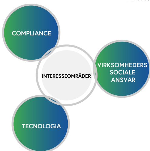
Interesseområder for EMMA4EU

Styrkerne og svaghederne ved hvert casestudie opsummeres, og læseren får en samlet vurdering ('relevant', 'relevant med identificerede begrænsninger', 'ikke direkte relateret til EUDR' eller 'med relevante begrænsninger'). Alle praktiske cases er også knyttet til tre EMMA4EU-fokusområder: compliance, virksomheders sociale ansvar og teknologi . Hele evalueringen vurderer ikke kun den innovative værdi af hver praksis, men letter også sammenligninger på tværs af cases og der kan drages overordnede konklusioner af ikke-relevante eller mindre vellykkede praksisser.